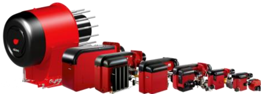
Polttimet 10 kW – 90 MW