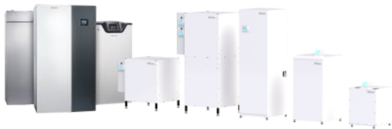
Kiinteistölämpöpumput 4 kW – 96kW