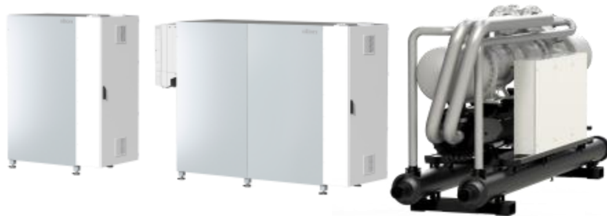
ChillHeat teollisuuslämpöpumput ja vedenjäähdyttimet 30 kW - 2500 kW