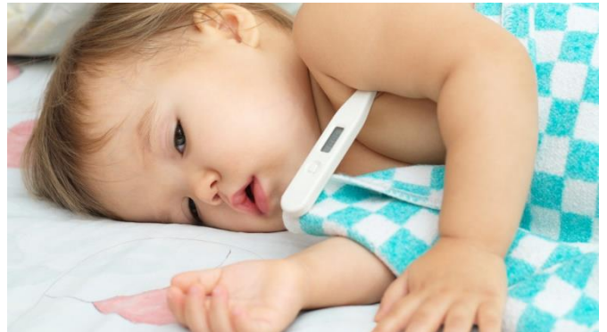
Kuva 1. Kuumeen voi mitata kainalosta.