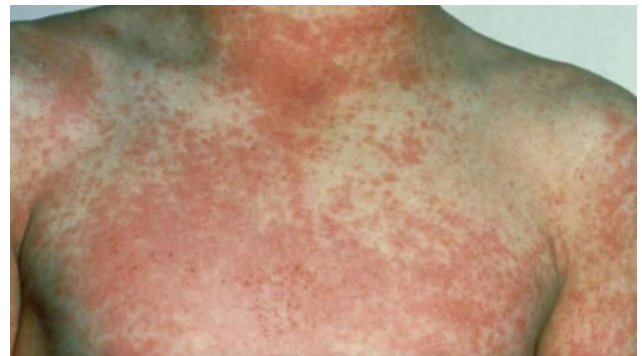
Kuva 6. Tulirokossa iholle tulee runsaasti punaisia näppyjä.