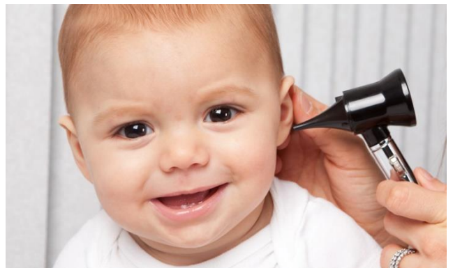
Kuva 3. Lääkäri tutkii lapsen korvaa.