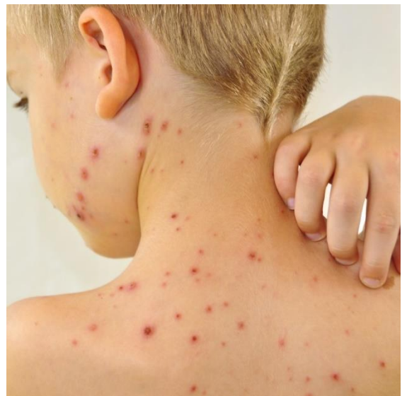
Kuva 4. Vesirokon näppyjä iholla.